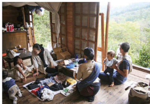
在山中长大的孩子，能充分感受自然、理解万物，这将使他们获得多元的幸福感。