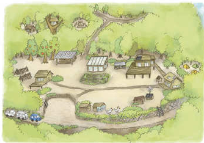
移居之初，加藤绘制的家的预定完成图，“不管想要做什么，事先的计划都非常重要”。