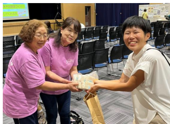
↑ 午後の上映終了後、白米9合を みなひろ食堂さんに寄贈しました。