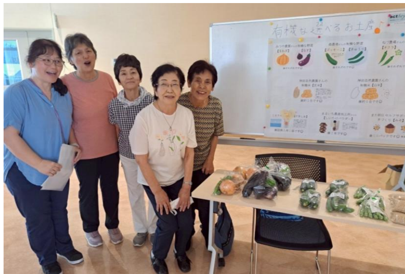
↑お土産を選んでいただくコーナー。 配布して下さるネットワークの方々。