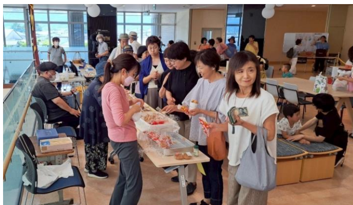
↑ 町内の福祉事業所の軽食等の販売の様子。 いのちのごはんのじゃがいもを使用した ポテトの販売もしていただきました。